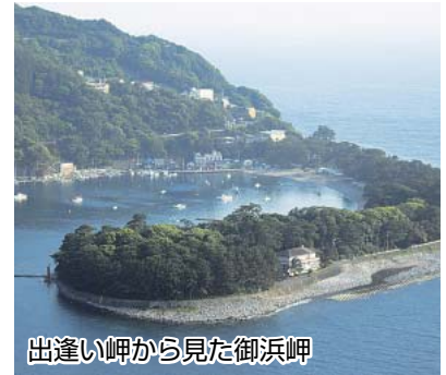
出逢い岬から見た御浜岬

出逢い岬とは、沼津の市街地から海岸を走り、大瀬崎を経由し、ダイビングスポットでも知られる井田地区を過ぎて程なく、戸田の市街地に入る直前に見えてくる展望台です。