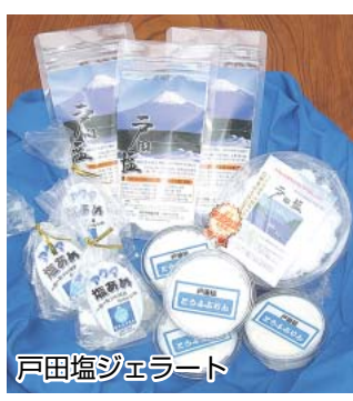
戸田塩ジェラート

が提案し、戸田出身のジェラート製造屋さんが作った戸田塩ジェラート。戸田の海をイメージしたエメラルドグリーンと戸田塩を使った甘しょっぱいアイスクリームです。サラリとした口どけと控えめな甘さでほんのりと淡く舌に残る塩味が魅力のジェラートで、後を引く美味しさが大人気です。