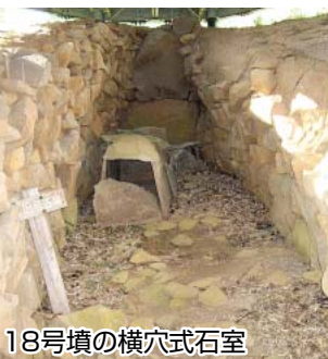
18号墳の横穴式石室

井田地区には集落南側の尾根上（県道一七号線）に松江古墳群があります。六世紀から七世紀にかけて築かれた遺跡であり、二九基の横穴式石室をもつ円墳で、壺や直刀、勾玉など数多くの出土品が確認されています。