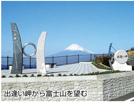
出逢い岬から富士山を望む

この展望台からは、中央に雄大な駿河湾を、右に霊峰富士山を、左に自然の形を残す戸田港と御浜岬を一望できます。 夏の景色は、冬には無い別の表情を感じることが出来ます。雪に覆われていた冬の富士山が、夏になると、登山者