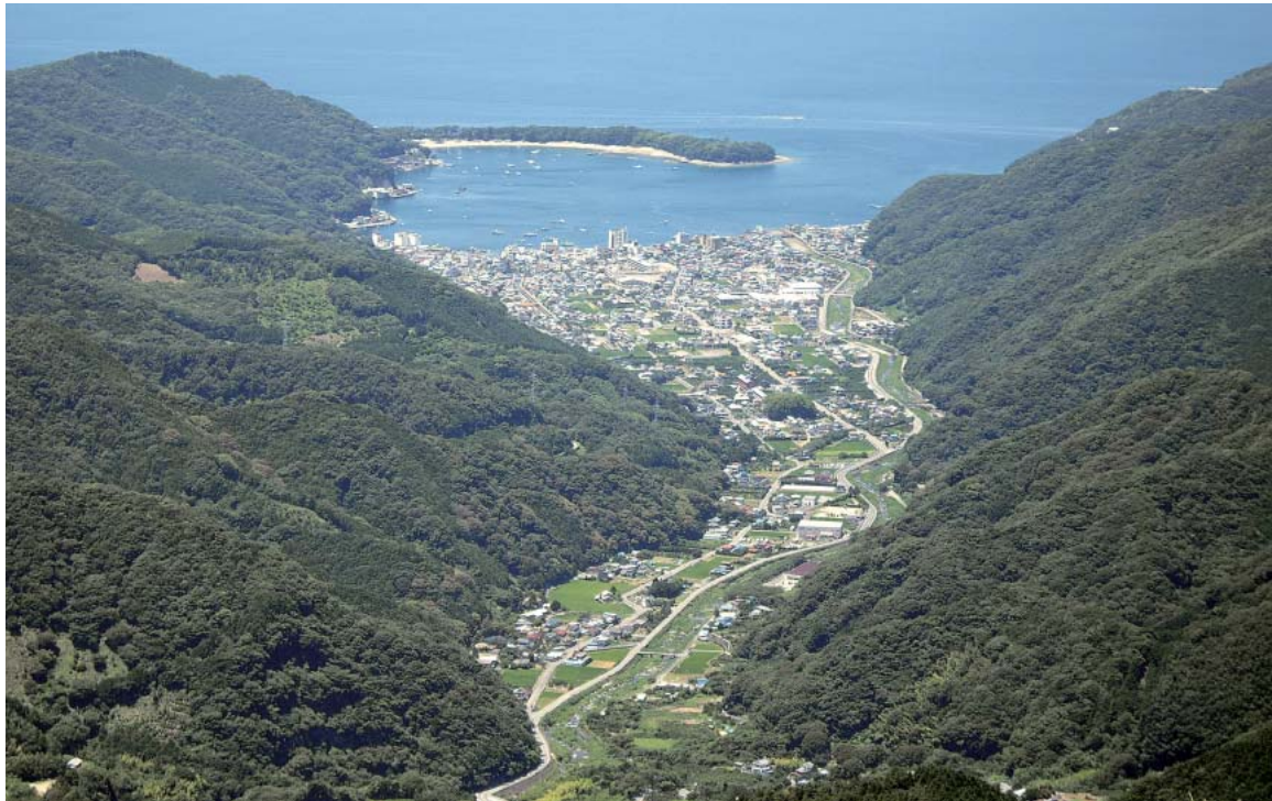
達磨山から見た戸田中心部