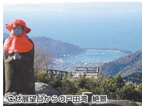
ごぜ展望台からの戸田湾 絶景

河湾を一望できます。夕暮れ時には西に沈む夕日を見ながら感傷に浸るのも良いのではないのでしょうか。 いずれの道路を経由しても、戸田には沢山の絶景ポイントがあります。夏の観光ドライブ、ツーリングを楽しんで頂くために、戸田は総ぐるみで美化にも努めています。 是非、夏の戸田を満喫して下さい。