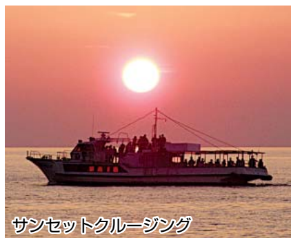
サンセットクルージング