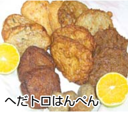
へだトロはんぺん